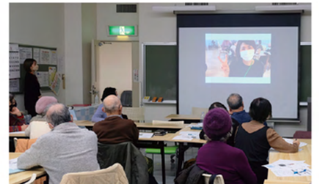
施設の雰囲気が伝わる動画が届きました！