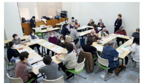
施設担当者との交流で熱心に話を聞かれる活動者のみなさま