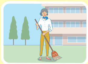
高齢者施設等での掃除、洗濯物の整理などの活動

神戸市内にお住まいの65歳以上の方が、高齢者施設等で下記の対象となる活動を行なった場合に、ポイントを貯めることができ、貯まったポイントは現金と交換できる制度です。