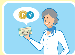
貯まったポイントは現金に交換