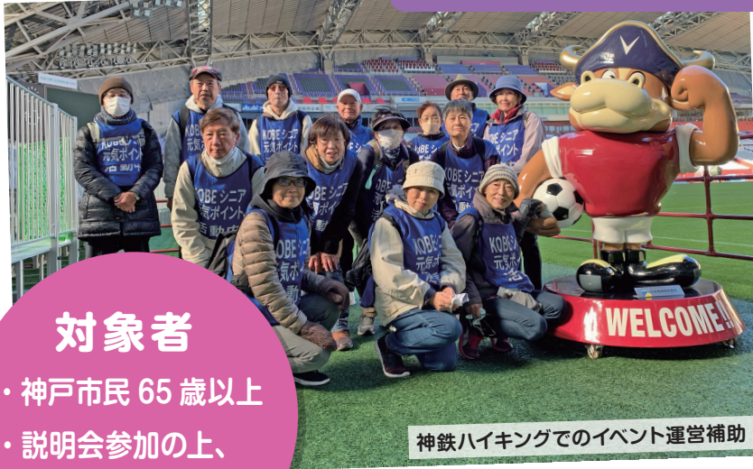
神鉄ハイキングでのイベント運営補助