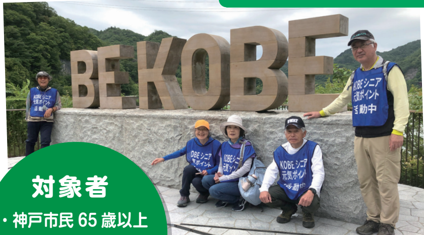
神鉄ハイキングでのイベント運営補助