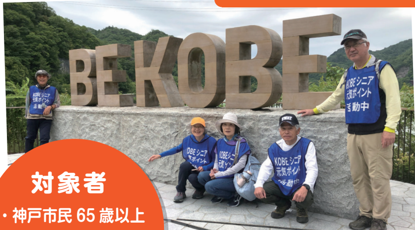
神鉄ハイキングでのイベント運営補助