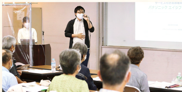
施設担当者による施設紹介