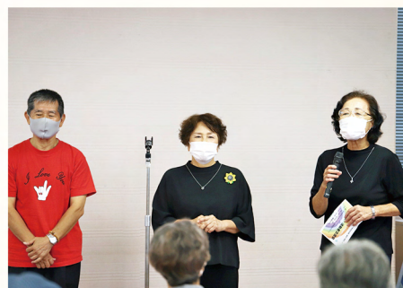
KSC手話ソング同好会のみなさま