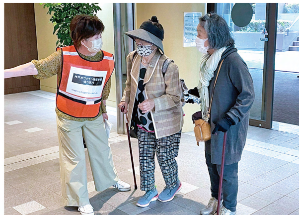
誘導案内の活動をされている様子

活動者のみなさまからは、「コロナ禍で、高齢者施設ではなかなか活動できなかったもので、少しでもお役に立てて嬉しかった」「外に出て、人の役に立てる機会をもらえて嬉しい! また参加したい」といったお声をいただきました。