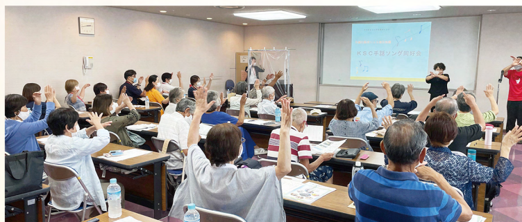
先輩活動者による演芸披露で会場は大盛り上がり♪

7月29日(木)に垂水区文化センターにて、須磨区・垂水区にお住まいの方を対象に交流会を行いました。施設紹介や先輩活動者のみなさまによる演芸披露、経験談など盛りだくさんの内容で行われました。7施設の担当者と33名の活動者のみなさまにご参加いただきました。その様子をご紹介します。