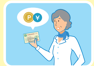
貯まったポイントは現金に交換