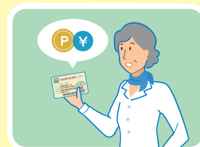
貯まったポイントは現金に交換