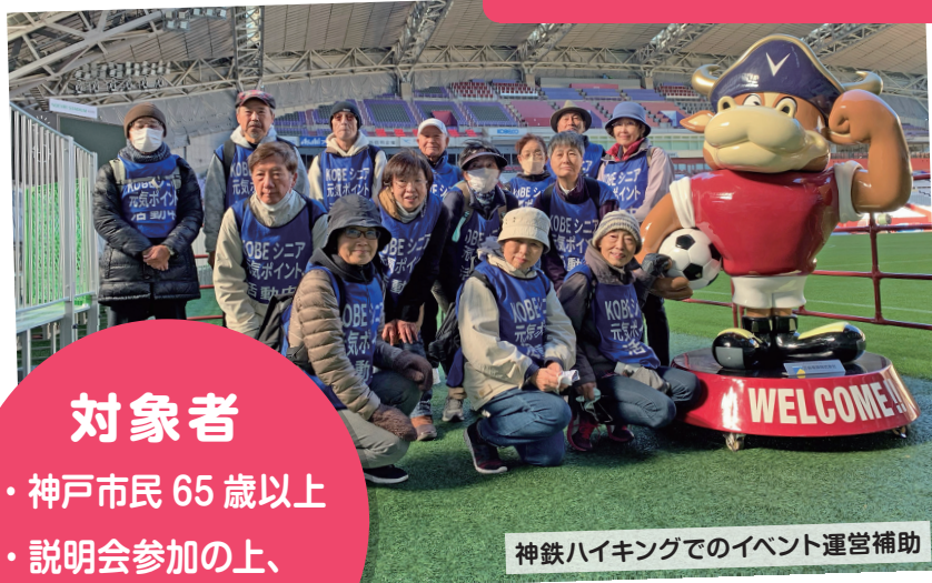
神鉄ハイキングでのイベント運営補助